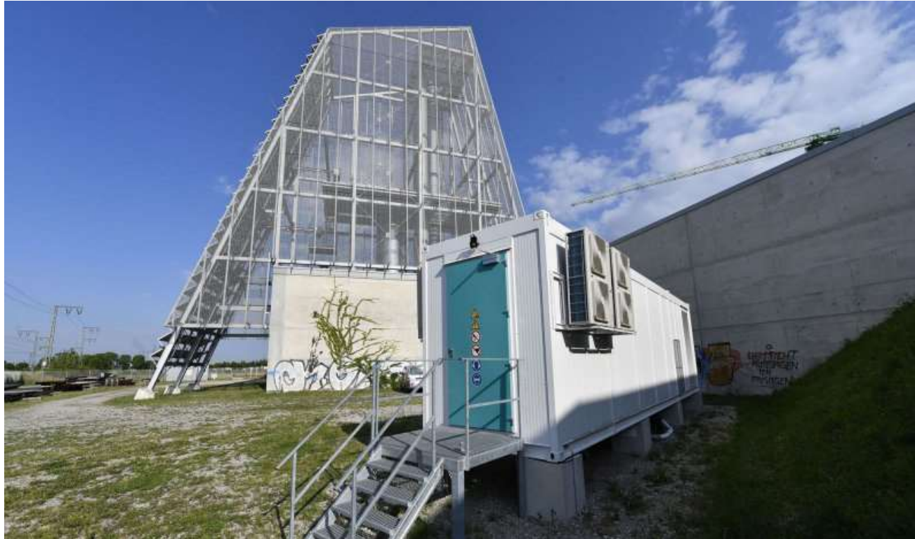
Geothermie-Heizwerk + Batteriespeicher (SWM)