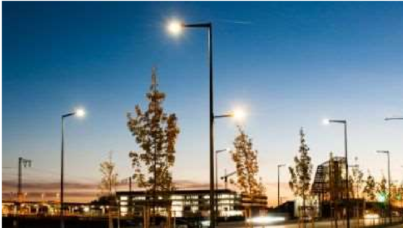
Intelligente Lichtmasten